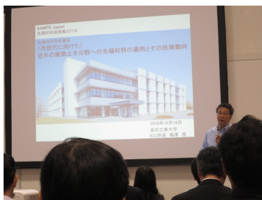
先端材料技術講座にて講演する鶴澤 潔 ICC 所長

先端材料技術講座『(次世代に向けた)近年の建築土木分野への先端材料の適用とその技術動向』の発表資料は下記よりダウンロード可能です。