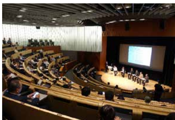
研究報告を行う鶴澤潔 研究リーダー(左) 有識者によるパネルディスカッション(右) (未来館ホール)