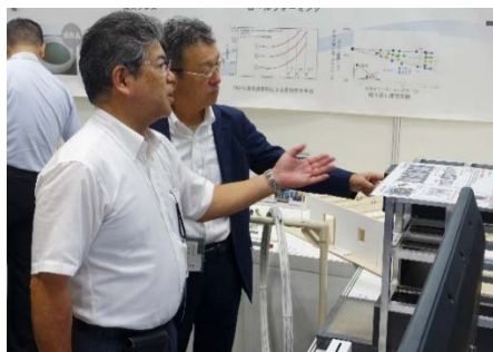
説明する池端機構長